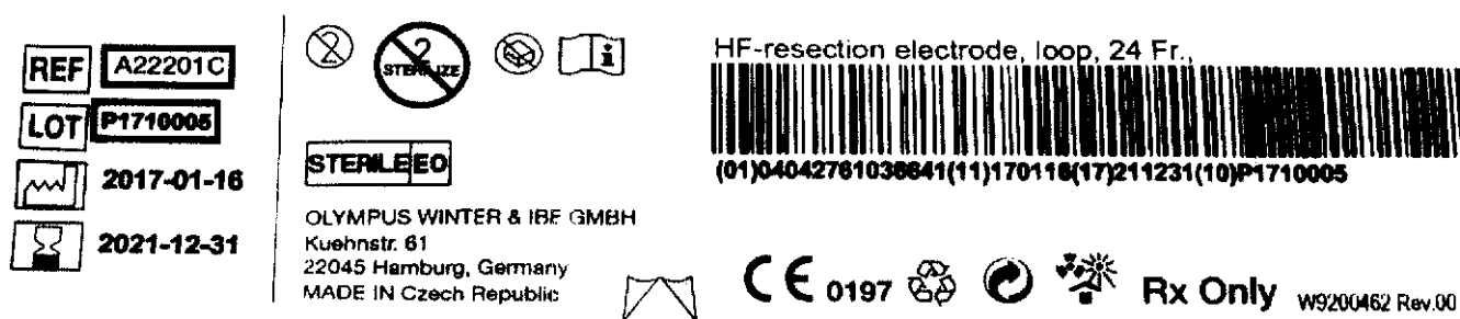
Figura 7: codice (REF) e numero di lotto (LOT) sull'etichetta dell'imballaggio blister